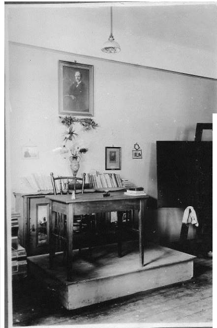
R. Rolland Zimmer