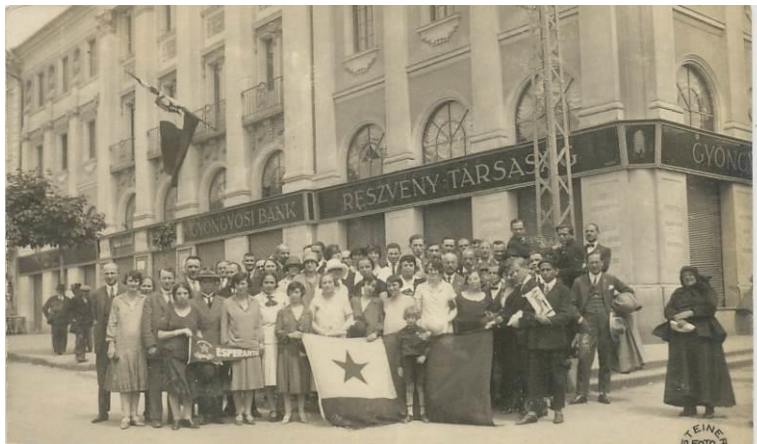
Eszperantisták felvonulása Gyöngyösön