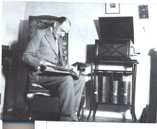
R. Rolland fordítások

Friedrich von Matthisson (1761-1831): Opferlied .